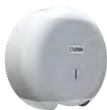
REF: CP-3006-B Acabado BLANCO