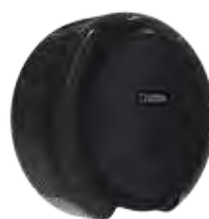
REF: CP-3006-BL Acabado NEGRO