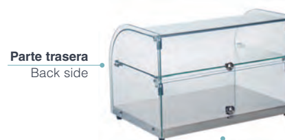
Parte trasera Back side