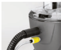
Conexión rápida y sin pérdidas