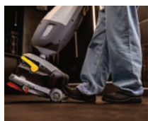
Posición de reposo