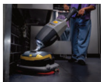
Iluminación de trabajo