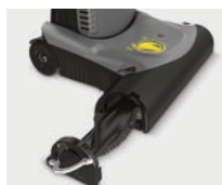
Cambio de cepillos sin herramientas