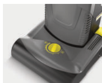
Ajuste manual del cepillo cilíndrico