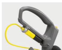
Sistema de sustitución rápida para cable de red