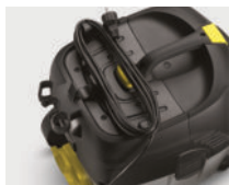
Ganchos de almacenaje para cable