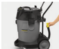
Manguera de desagüe incorporada