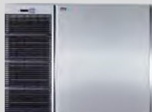
APILABLE / OPCIONAL MONOFÁSICA 220 V (A-REF:14350/W-REF:14351) EMPILHÁVEL / MONOFÁSICA 220 V OPCIONAL (A-REF:14350/W-REF:14351)