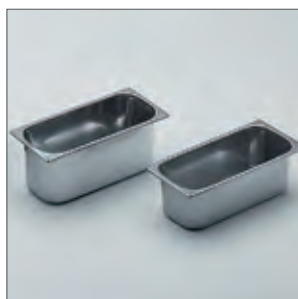
Cubetas en acero inox. 5 y 7 L. de capacidad.