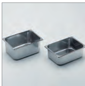
Cubetas en acero inox. 10 y 12 L. de capacidad.