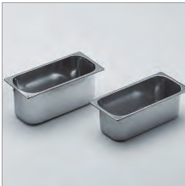
Cubetas en acero inox. 5 y 7 L. de