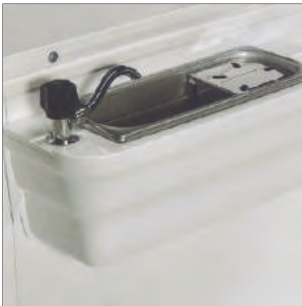
Lavaporcionador con grifo (accesorio).