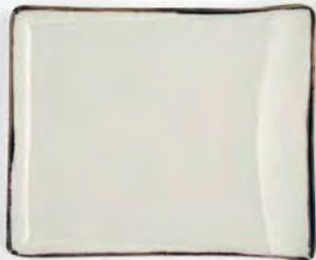
FUENTE 21,5 X 18 CM. CREMA MANGAN