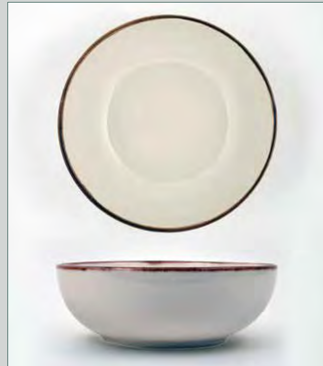
ENSALADERA 20,5 CM. CREMA MANGAN