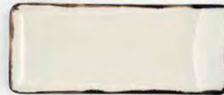
FUENTE 21,5 X 9 CM. CREMA MANGAN