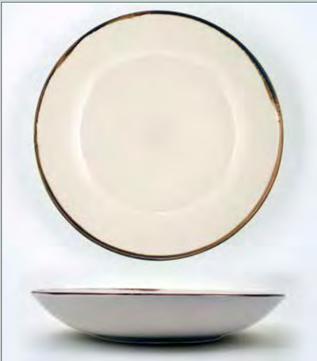
PLATO 25,5 CM. CUP CREMA MANGAN