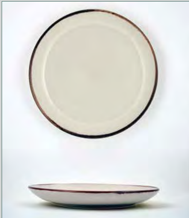
PLATO 20,5 CM. LLANO POSTRE CREMA MANGAN