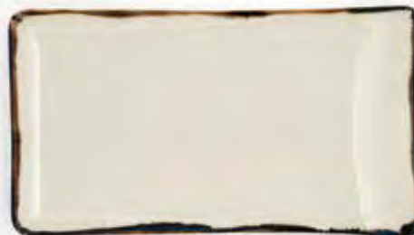
FUENTE 21,5 X 12 CM. CREMA MANGAN