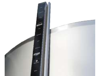
Regleta de nivel

Los depósitos se realizan solamente bajo pedido, lo que nos permite adaptarnos a las necesidades de nuestros clientes.