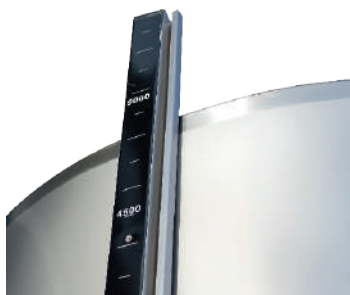
Regleta de nivel