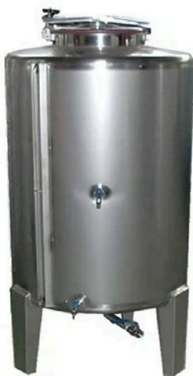
DEPÓSITO ECO INOX CERRADO FONDO CÓNICO BOCA SUPERIOR