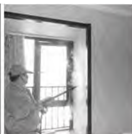
Contaminación del hogar