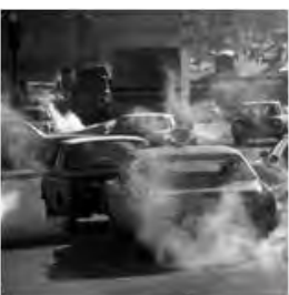
Emissiones de automóviles