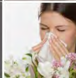
Polen y alergenos