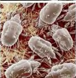
Ácaros y similares