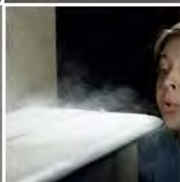
Polvo y partículas flotantes