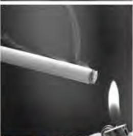
Humo de cigarrillos