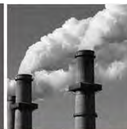
Contaminación de las industrias