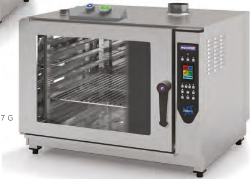
Mod. CDT 207 G