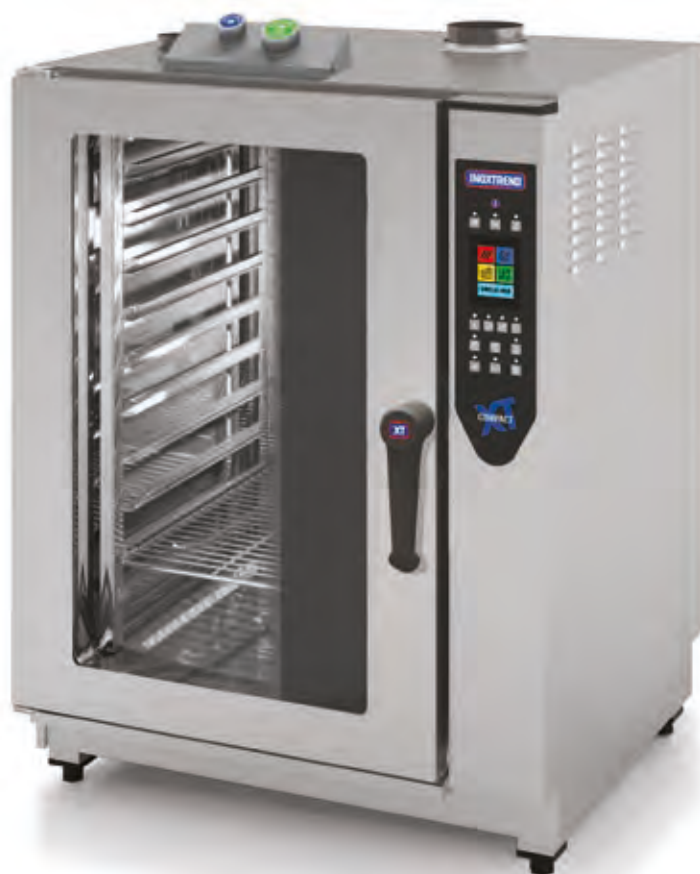
Mod. CDT-111 E