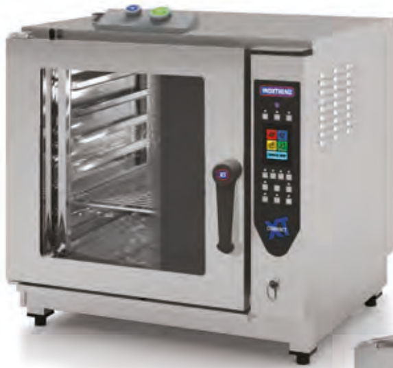
Mod. CDT 107 E