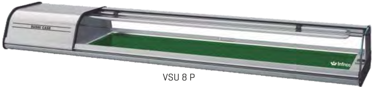
VSU 8 P

Expositor sushi, pescado y marisco / Sushi, fish and seafood display case / Vitrine sushi, poisson et crustacés