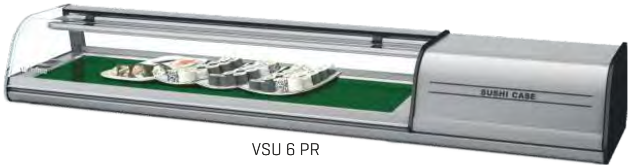
VSU 6 PR