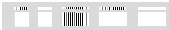
GR 41 L