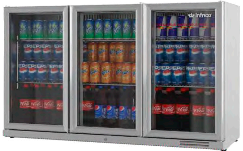
ERV 35 II XS