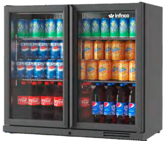
ERV 25 XS