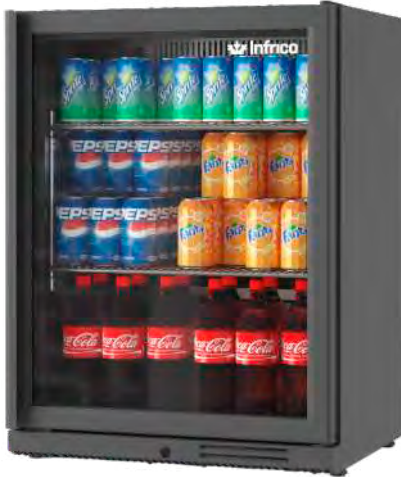
ERV 15 XS