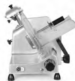
C 300 ACEV / C 350 ACEV