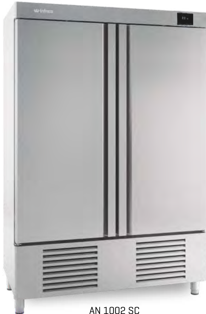
AN 1002 SC