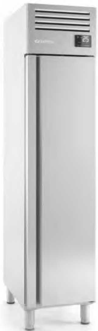
AGN 301 BT

LED lighting incorporated, reducing energetic consumption between 80% and 90% respect to a traditional lighth bulb.