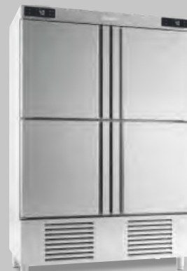
ANDP 1004 TF/G