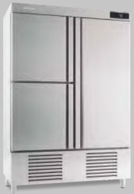
AN 1003 BT