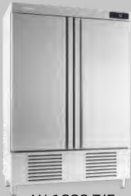
AN 1002 T/F