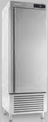
AN 501 BT