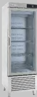
AN 501 BT CR