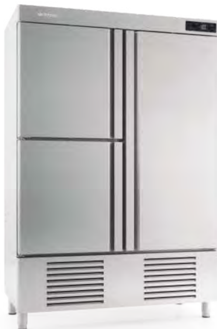
AN 1003 T/F