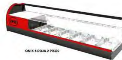
ONIX 6 ROJA 2 PISOS