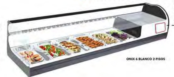
ONIX 6 BLANCO 2 PISOS