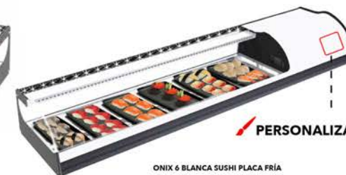
ONIX 6 BLANCA SUSHI PLACA FRÍA