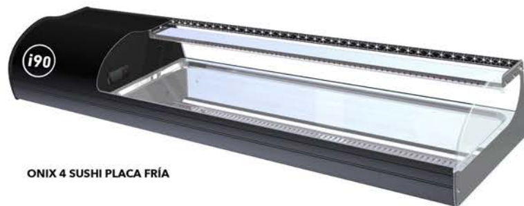
ONIX 4 SUSHI PLACA FRÍA