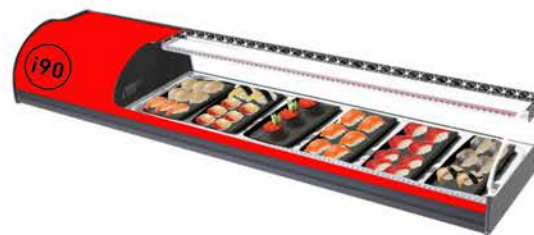
ONIX 6 ROJA SUSHI PLACA FRÍA