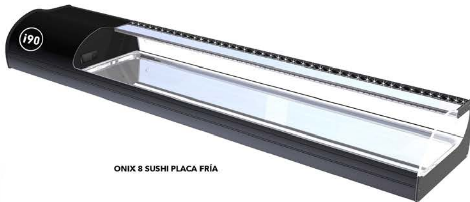
ONIX 8 SUSHI PLACA FRÍA