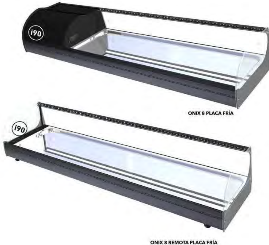
ONIX 8 PLACA FRÍA