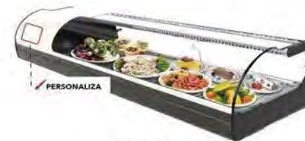
ONIX 6 BLANCA PLACA FRÍA

Fidelice a su cliente personalizando el producto