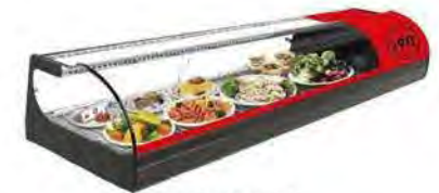
ONIX 6 ROJA PLACA FRÍA