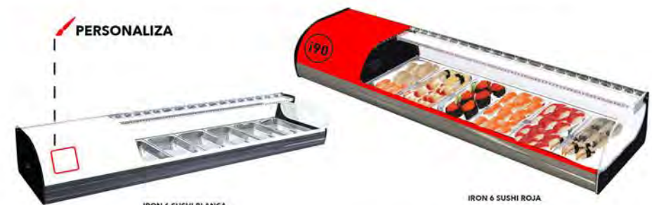
IRON 6 SUSHI BLANCA