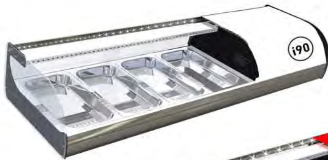
IRON 4 SUSHI BLANCA