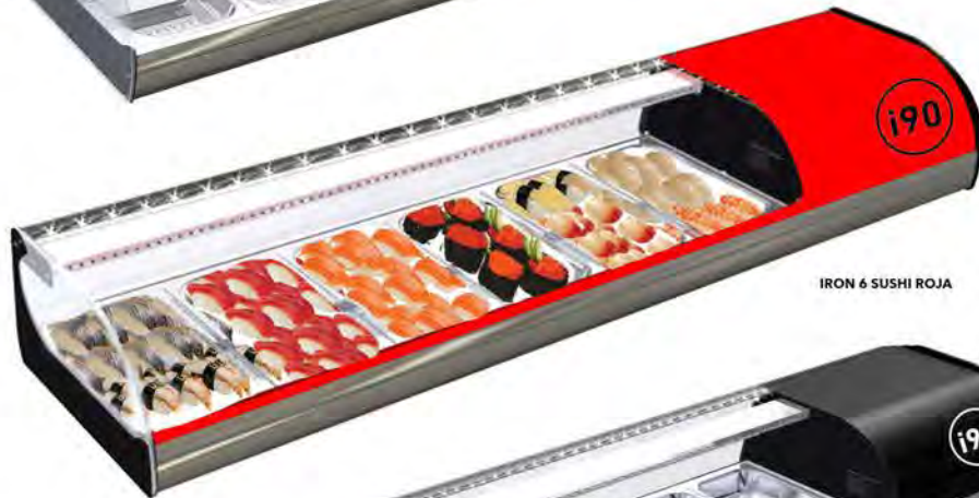
IRON 6 SUSHI ROJA