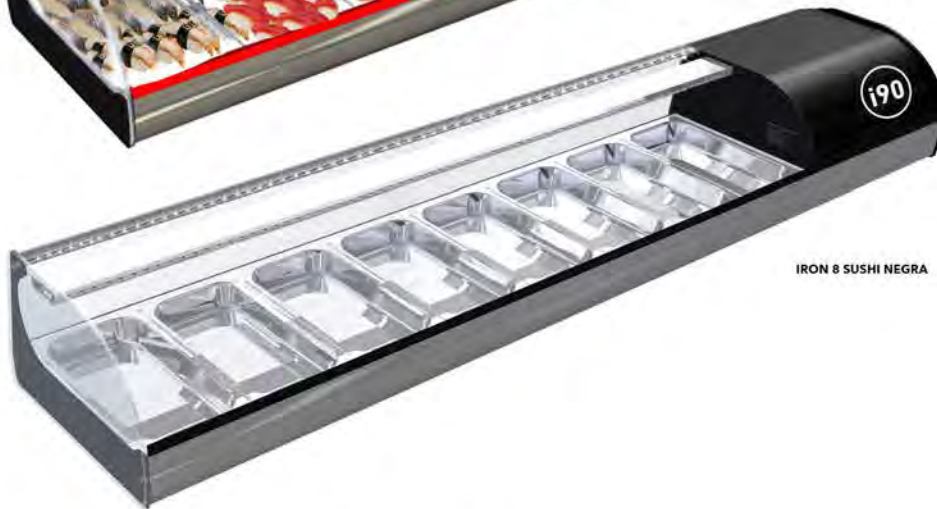
IRON 8 SUSHI NEGRA