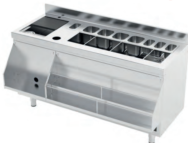
Ejemplo de composición. Cubetas GN 6/1 y mochilas no incluidas.