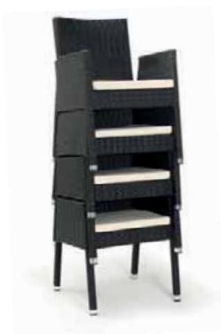
▶▶ SILLÓN MOD. TORONTO MÉDULA CAFÉ