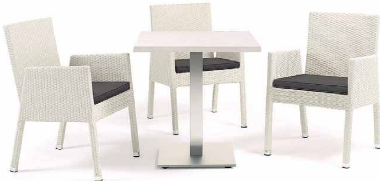
▲ MESA MOD. MUNICH BASE ALUMINIO INTERIOR PLANCHA ACERO COLUMNA ALUMINIO TABLERO ANTÁRTIDA