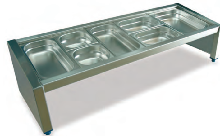
Ref. 082803, 082804, 082806.