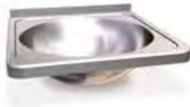
Esquinas redondeadas Rounded corners Coins arrondis

Il est muni d'un distributeur d'essuie-mains qui permet d'introduire des boîtes de taille standard et qui peut être utilisé aussi comme distributeur de gants et de masques.