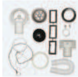
1 X 454202