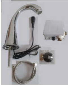
1 X 060804