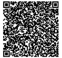
Imagen Productos Relacionados