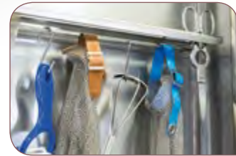
Barra para colgar accesorios.