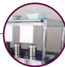
Porta-notas mural Wall mounted note-holder Porte-notes mural