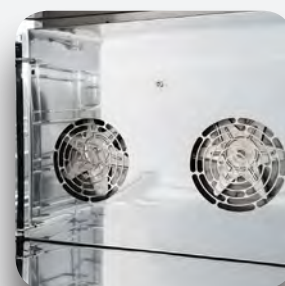
Fabricado en acero inoxidable.