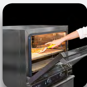
Kit piedra pizza.