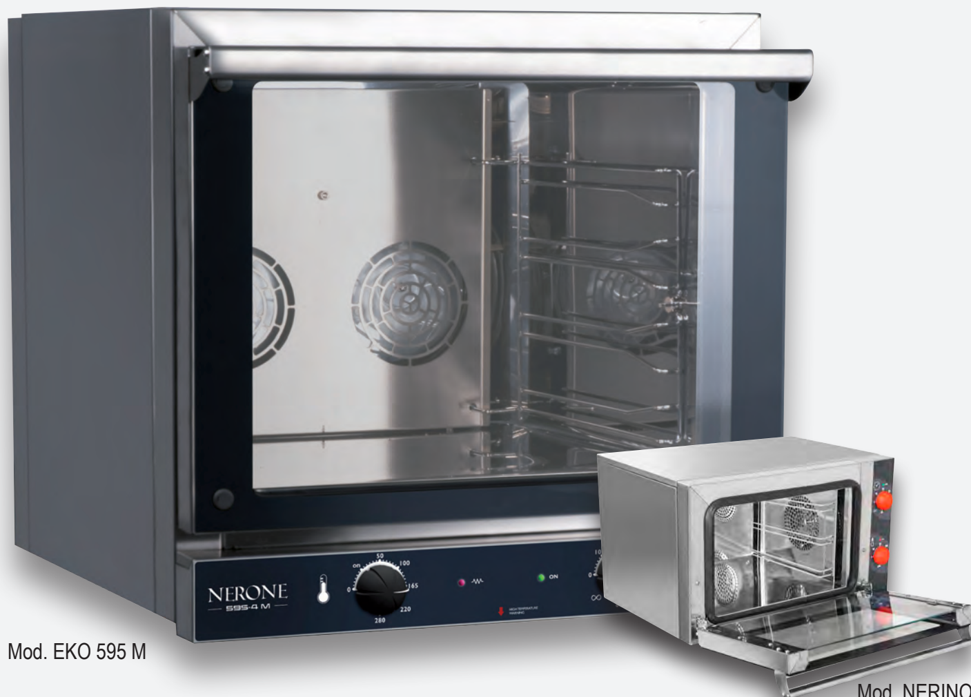
Mod. EKO 595 M