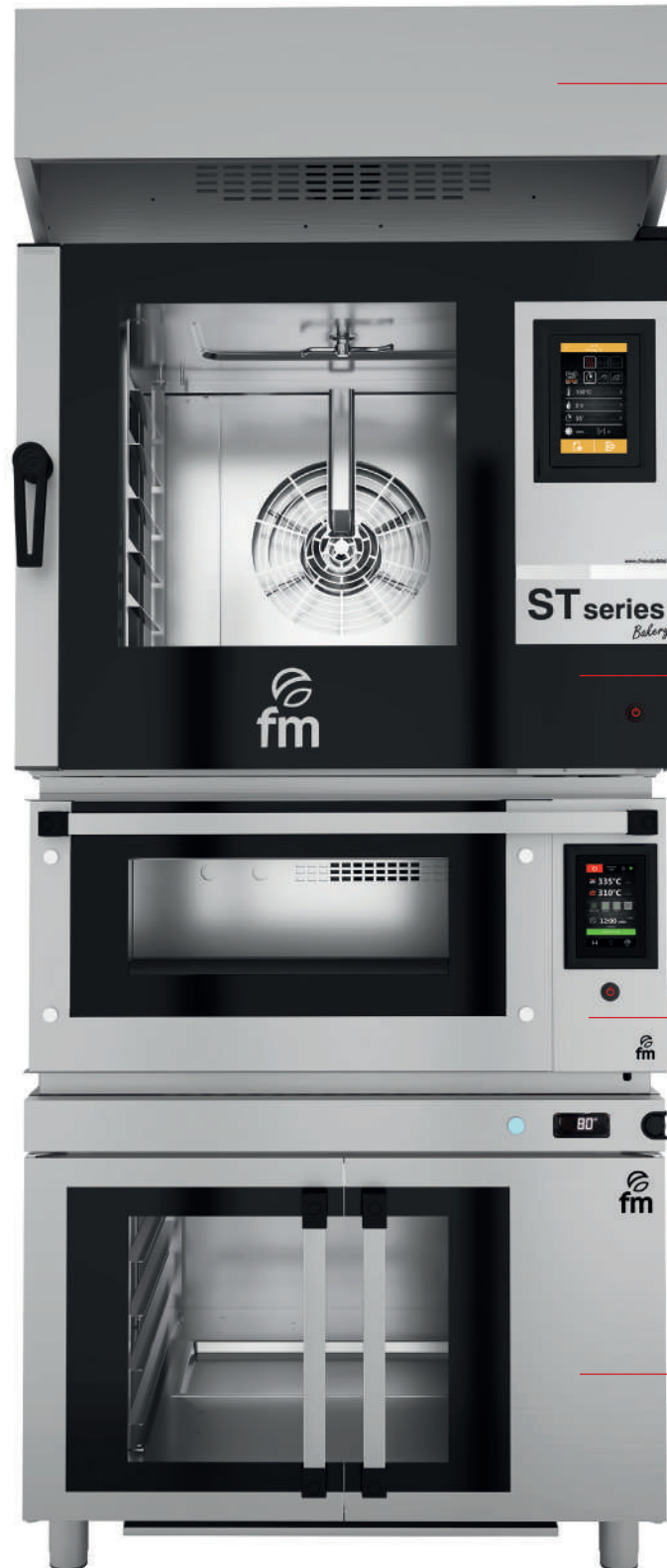
CAMPANA ST BAKERY (REF. 710515)