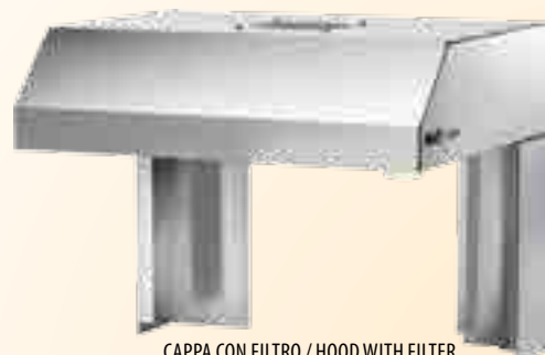
CAPPA CON FILTRO / HOOD WITH FILTER