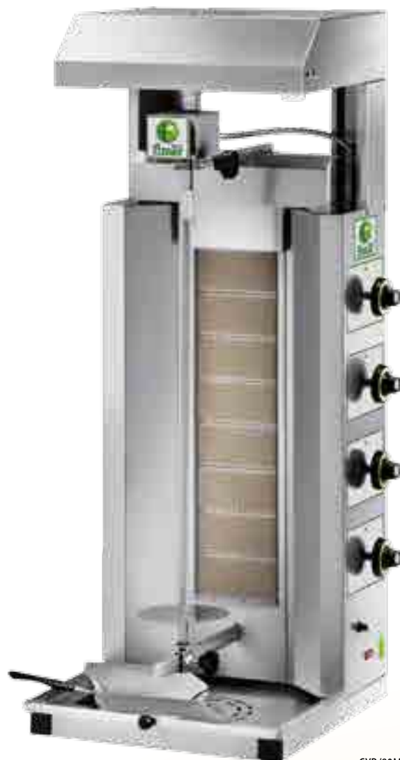
GYR/80M CON CAPPA CON FILTRO / WITH HOOD WITH FILTER (OPTIONAL)

Kit de vitres de protection - hotte avec filtre au charbon actif 230V/1N/50Hz, 24W.