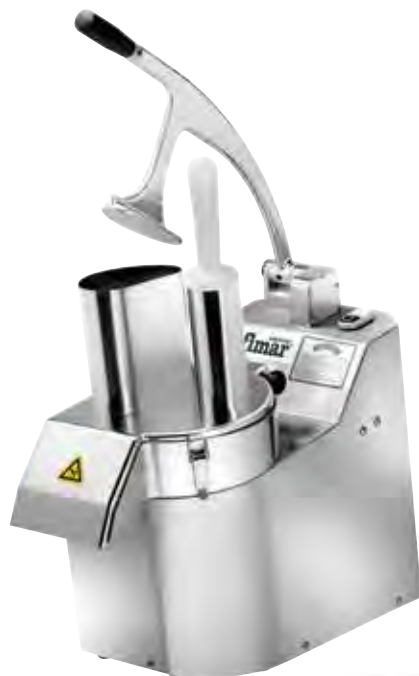
TV2000RN - "LA ROMAGNOLA"