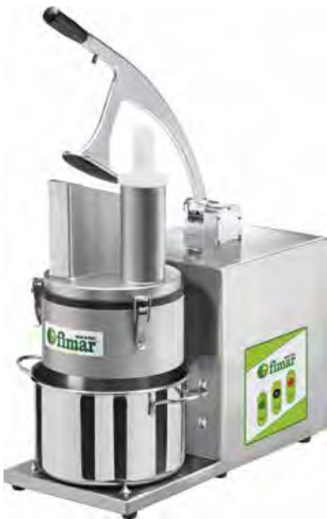
TV4000 - "L'ORTOLANA"