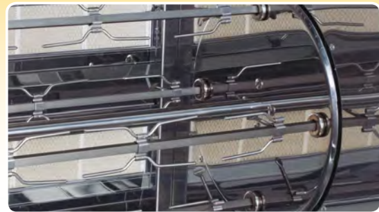
Detalle bombo | Detalle bombo | Detalle bombo