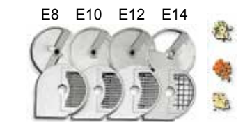
Ref.: D8X8, D10X10, D12X12, D20X20 ..... En combinación con: E8/E10/E12/E14 Ref.: E8, E10, E12, E14 .....