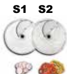
Ref. S1, S2 .....