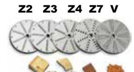
Ref. Z2, Z3, Z4, Z7, V .....