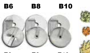
Ref.: B6, B8, B10 ..... En combinación con: E6/E8/E10 Ref.: E6, E8, E10 .....