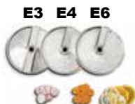
Ref. E3, E4, E6 ....