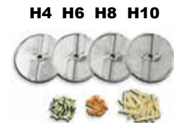
Ref.: H4, H6, H8, H10 .....

* Porte no incluido (discos sin maquina)