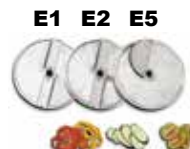
Ref. E1, E2, E5 ...