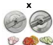
Ref. X ..... Regulable de 1 a 8 mm