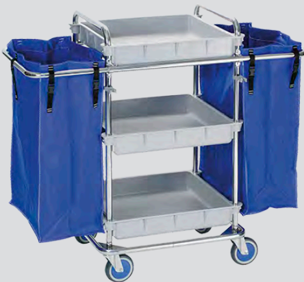
CSH-3 / CSH-4