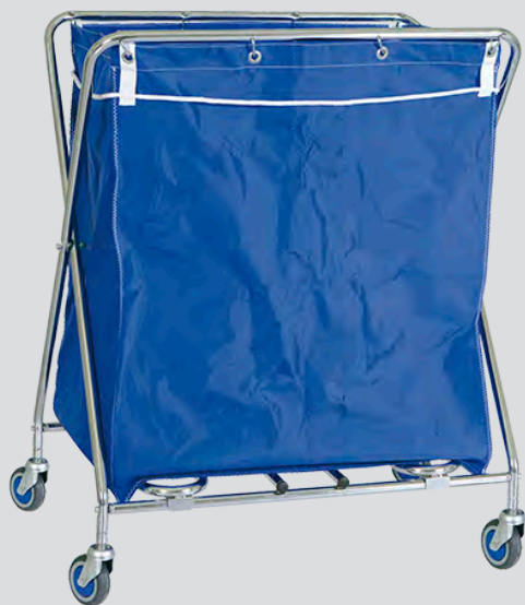
CRS-10 / 20 / 35 / 40