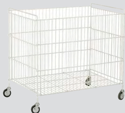
CS-115 / 212 / 365