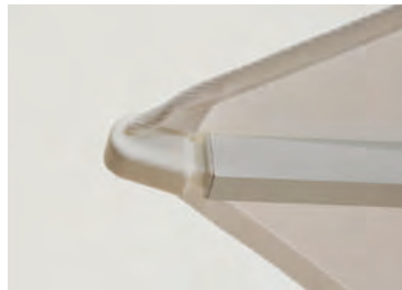
Elastic tips for fabric attachment