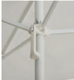
Push-up open system with release button