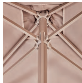
Ribs without screws for an easier replacement