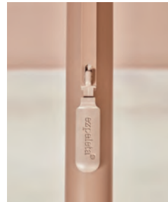
Easy open /close system