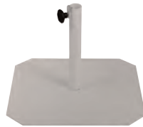
BSO500GR4003 - ø40 BSO500GR4503 - ø45 Grey