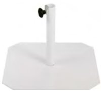
BSO500BC4002 - ø40 White