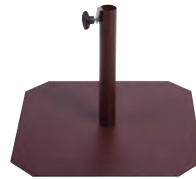
BSO500OX4000 - ø40 Rust