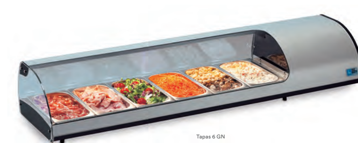
Tapas 6 GN