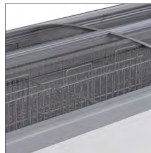
Rejillas perimetrales incluidas.