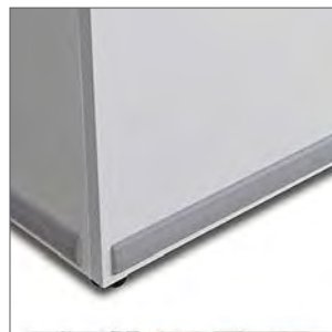
Parachoques de protección.