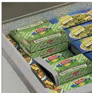
Tapas correderas de cristal con asas.