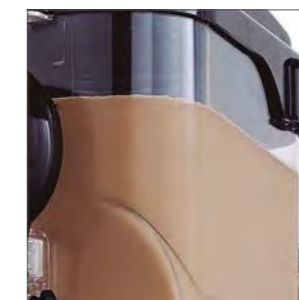
Elevada capacidad productiva de cada depósito (5 L.)