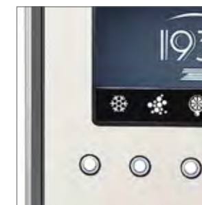
Gemini con disponibilidad de elección entre agua fría, con gas y dos tipos de zumo de gran calidad.