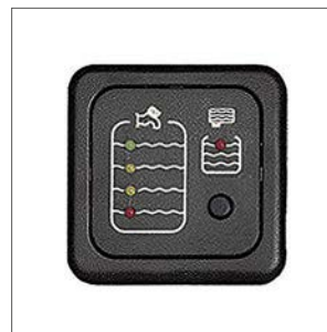
Indicador de nivel del modelo F200C.