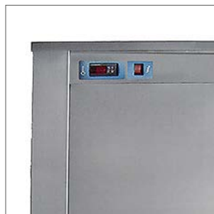
Incorpora centralita electrónica para la regulación y visualización de la temperatura del agua.