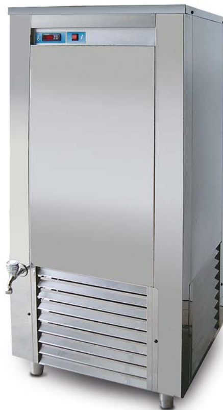
E 300 AC