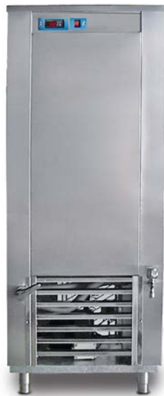
E 200 AC