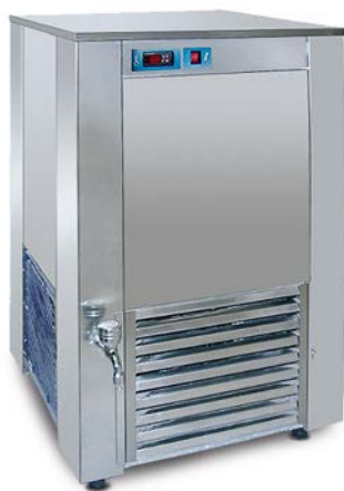
E 100 AC