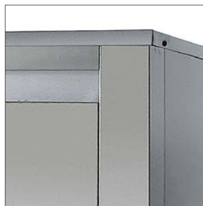
Acabados exteriores en acero inox.