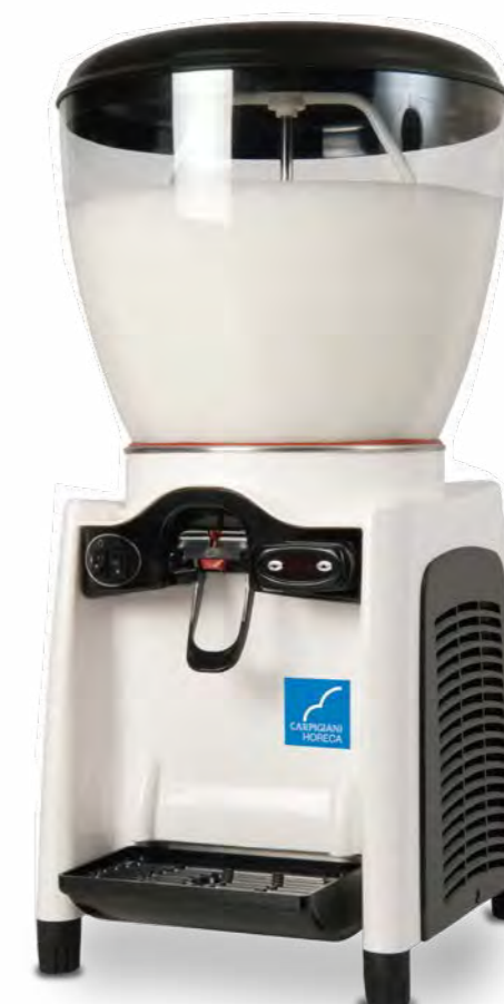
Drink magic 20