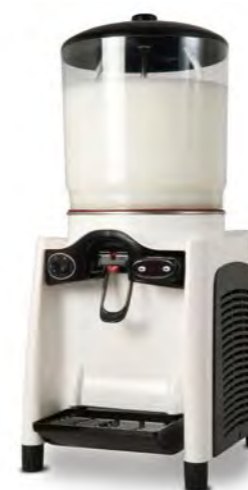
Drink magic 12