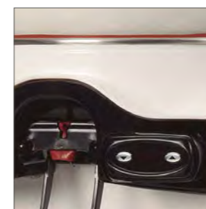
Incorporan control electrónico para la regulación de la temperatura del producto en el depósito.