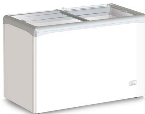
VIC 330 CSV