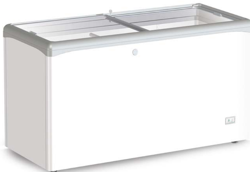
VIC 440 CSV