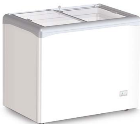
VIC 220 CSV